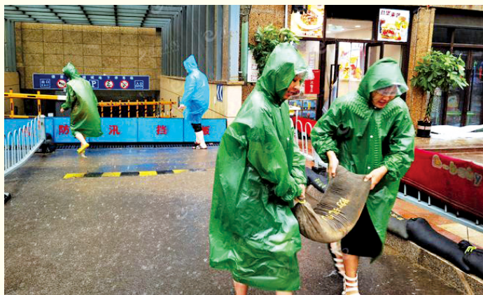
7月28日,山东省滕州市君瑞城社区志愿者冒雨装沙袋、扛沙袋,奋勇守护群众的生命和财产安全。