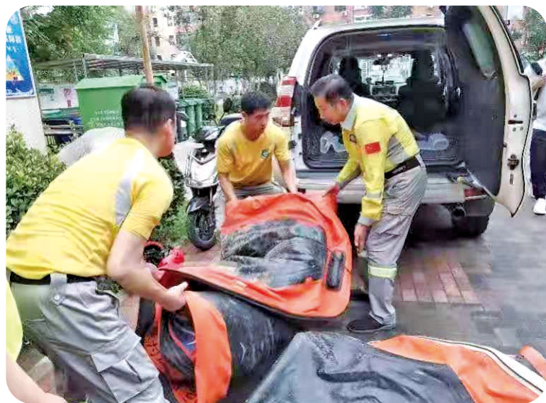
绿舟救援队正在将冲锋舟装上车辆。

（作者系北京市公益领域社会服务机构第四联合党委副书记；绿舟、蓝天应急救援队队员）