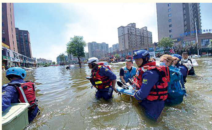
7月22日,湖南省红十字蓝天救援中心志愿者在郑州成功转移灾区群众200多人。