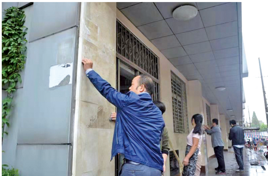
作者在钟楼社区张贴防疫宣传海报。

名党员志愿者,下沉社区,值守楼栋;我作为校办主任,协调物资,值班校园;同时我还是一名宣传战士。