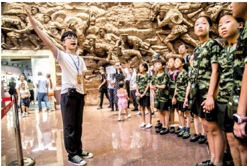
小小讲解员志愿者在给小小参观者做讲解。

坚持一个理念,在小小讲解员心中播下红色火种。 八一馆坚持培育“专家式”志愿者理念,对小小讲