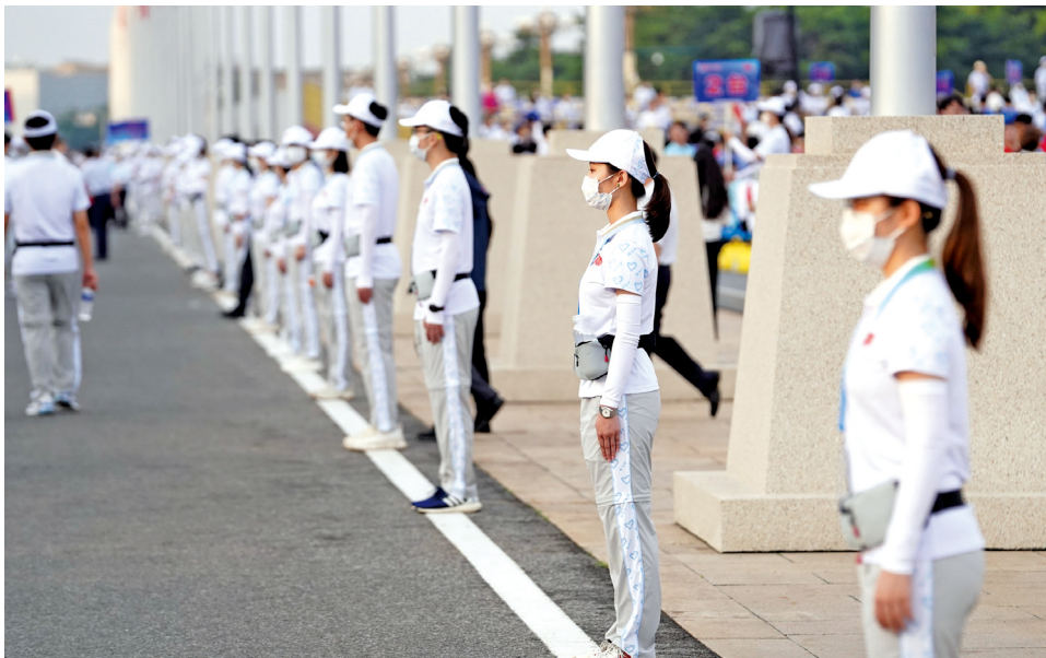
7月1日上午，在天安门广场的志愿者满怀热情地坚守岗位。