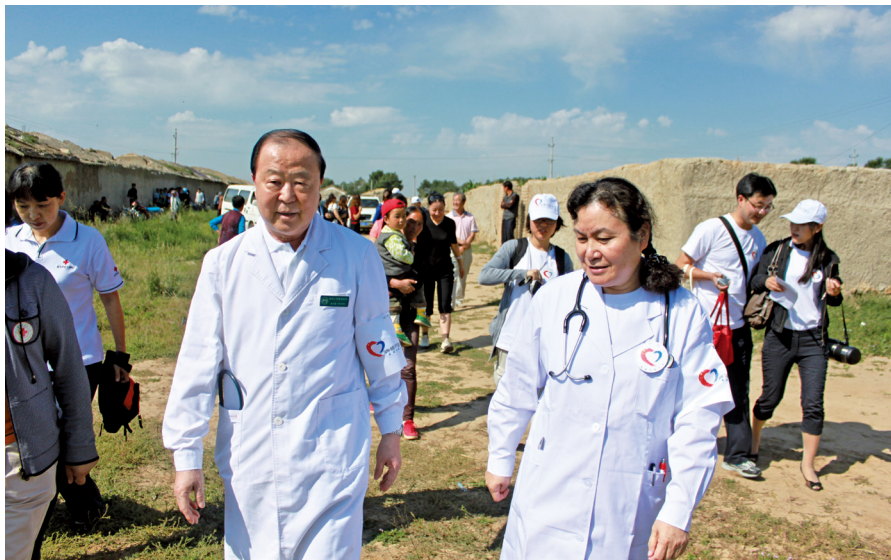
2012年7月24日,烈日当头,高院士同随行的几位北京专家走进内蒙古阿拉善盟,这里有位70岁上下的心血管患者亟待他的诊治。

“同心·共铸中国心”公益活动的大旗打出来后,迫切需要一位德高望重的工程院院士扛起这面大旗,