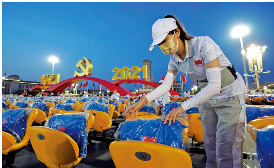
7月1日清晨,志愿者在天安门广场紧张忙碌地为观众席摆放物品。

提供了活动引导、集结点引导、线路引导、观礼台服务、安全应急等志愿服务。志愿者虽身在广场,却只能听庆祝大会,在心中为党的生日默默祝福。大多数志愿者坚守在广场外的岗位上,与广场“遥相呼应、同频共振”,祝福伟大的党“百年华诞”。二是为文艺演出添彩。《伟大征程》文艺演出前后演出3场,每场都在国家体育场内和周边安排了3600多名志愿者,提供了文明引导、观众台服务、岗位值守等“保姆式”志愿服务。盛夏的北京中轴