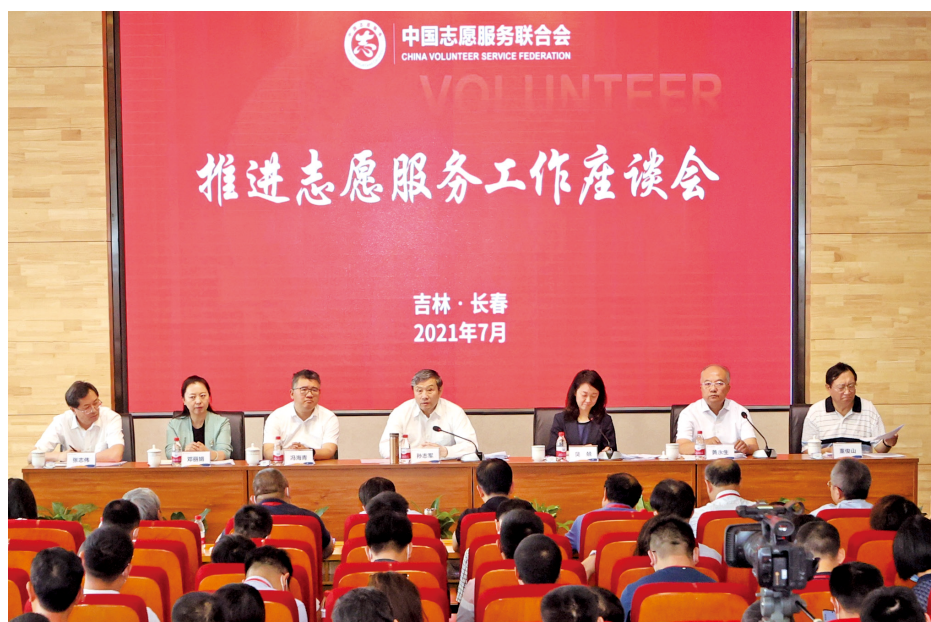
培训班召开推进志愿服务工作座谈会。

志愿服务组织加强自身建设、科学有序组织活动,善于用好新媒体平台,不断提升志愿服务组织化程度;加强志愿服务理论、制度、机制研究和实践培训,为推动志愿服务事业发展夯实基础、储备力量。专家授课深入浅出讲清中国特色志愿服务发展的理论依据,详实剖析一批认可度高、操作性强、易复制推广的组织建设和项目实例。13位学员的经验分享和5场实地观摩、现场体验,让学员切身感受到志愿服务“怎样开展好”,志愿服务组织建设“如何(下转第16页)