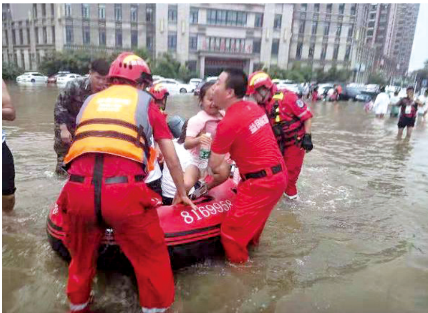
山东省淄博市桓台益民救援队在紧急救援中。

防汛救灾水上救援志愿服务总队是依托郑州市红十字水上义务救援队,由各地支援河南的水上救援志愿服务队的集合组建,在郑州紫荆山宾馆建立指挥