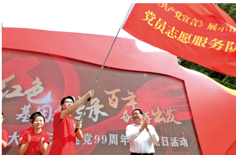
2020年7月1日上海市委书记李强在复旦大学向《共产党宣言》展示馆党员志愿服务队授队旗。

以理论研究为先导,上海成立市志愿服务研究中心,连续第六年发布年度《上海志愿服务发展报告》,连续第三年出版《上海志愿服务发展蓝皮书》。以专业培训为核心,开展以集中授课、实操演练、网络直播相结合的常态化文明实践和志愿服务培训,通过线上线下、分层分类、理论与实践相结合的形式,切实提高工