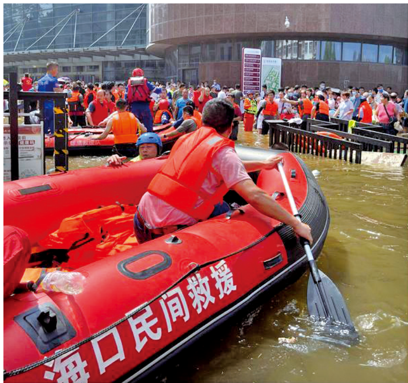
海南省海口民间救援队在河南省卫辉市开展应急救援。

为支持受灾地区恢复生产,河南省文明办还会同农业、水利、住建等部门,组织专业志愿服务队伍对水