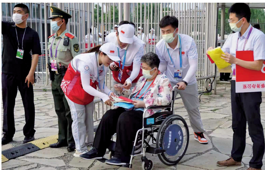
6月28日下午,志愿者在“鸟巢”为观众提供进场引导志愿服务。

分工明确、衔接有序。二是认真编制实施方案。按照统筹协调、分口负责,传承创新、规范服务,充分保障、精细节俭,严格审核、安全为先的原则,梳理77项工作任务,制定了详实的志愿者工作方案,确保志愿服务工作细化到岗、明确到点、落实到人。三是切实做好演习操练。围绕庆祝活动,全流程系统梳理志愿服务招募、培训、管理、保障、激励等工作中的风险点43项,有针对性编制应