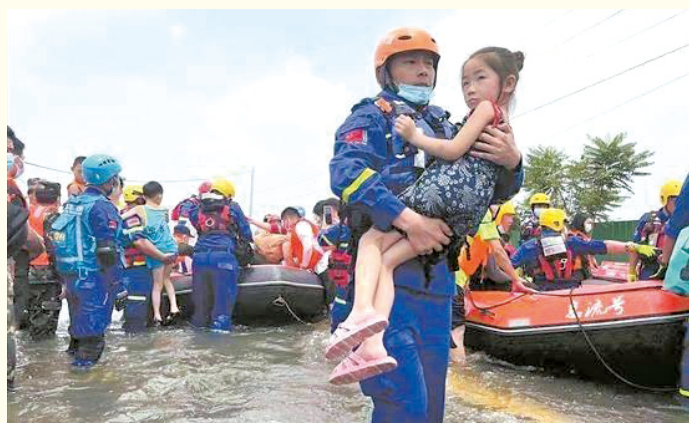
7月25日,福建省泉州市蓝天救援队迅速驰援,在河南新乡转移救出60多名受困群众。