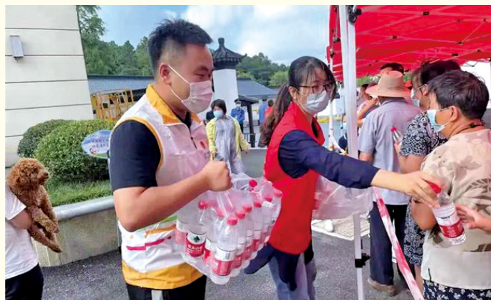
南京市志愿者与医护人员、党员干部并肩奋战,加强疫情防控。