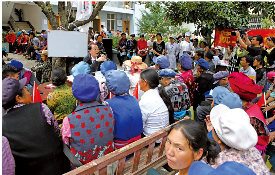
院士健康大讲堂现场，云南省迪庆州维西县巴迪乡卫生院内已被围得水泄不通。