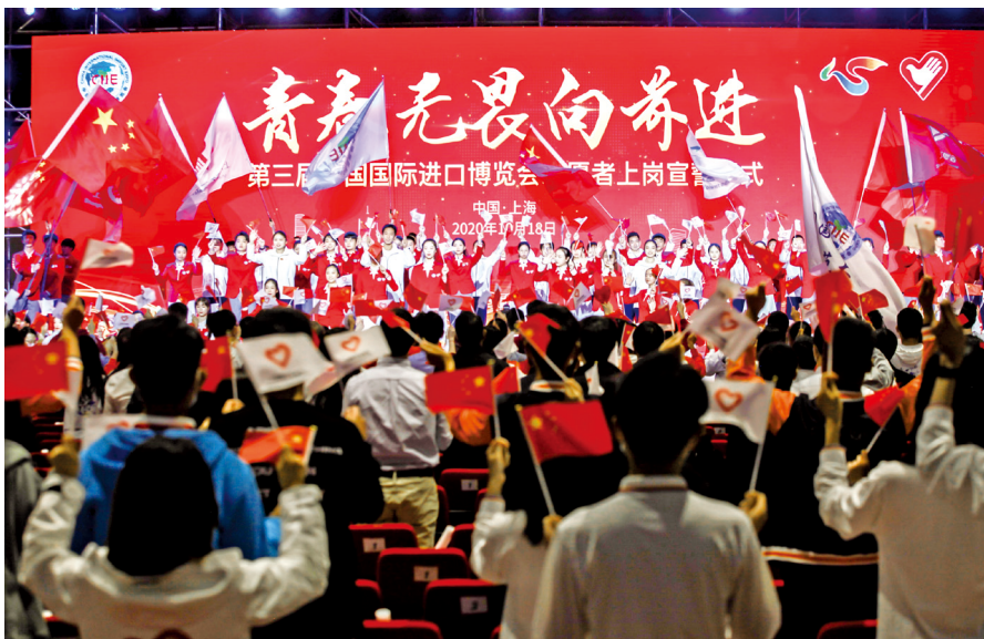
2020年10月18日,第三届中国国际进口博览会志愿者上岗宣誓仪式在国家会展中心举行。

完善文明实践和志愿服务运行机制,统筹推进“学习宣传理论政策”“培育践行主流价值”“创新开展文明创建”“大力弘扬时代新风”“丰富精神文化生活”“壮大志愿服务队伍”六项工作,持续推进阵地资源整合到位、体制机制健全到位、服务群众精准到位。全市16个区已建成16个区级新时代文明实践中心、221个乡镇(街道)级新时代文明实践分中心、6025个村(居)级新时代文明实践站,实现三级阵地全覆盖,因地制宜打造文明实践“示范带”“实践点”等693个特色阵地,此项工作受到中央宣传部调研组的充分肯定。通过上线“上海市新时代文明实践综合服务平台”,完善“新闻发布、宣传展示、互动交流、供需对接、目标管理、统计分析”六大功能,实现与“上海志愿者”网站功能衔接和互补,强化资源跨界整合、供需高效匹配、精准服务群众,实现“供单、点单、派单、接单、评单”服务流程全闭环管理,完成了超过2万项资源供需对接,其中市区条块联动项目1000余项,群众点单超过33万人次,满意度超过90%,打通宣传群众、教育群众、关心群众、服务群众的“最后一公里”。推动新时代文明实践中心建设和社区志愿服务体系建设相互融入、双向提升,出台上海市新时代文明实践中心(分中心)评估标准,构建新时代文明实践中心(分中心)统筹规划、区志愿服务指导中心(社区志愿服务中心)组织实施、志愿服务队伍各展所长、志愿服务站点承接落地的文明