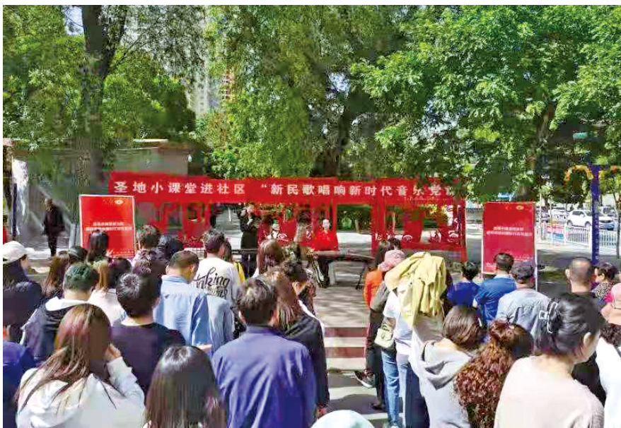
延安文艺宣讲师在宝塔区南桥社区开展音乐党课“六进活动”。