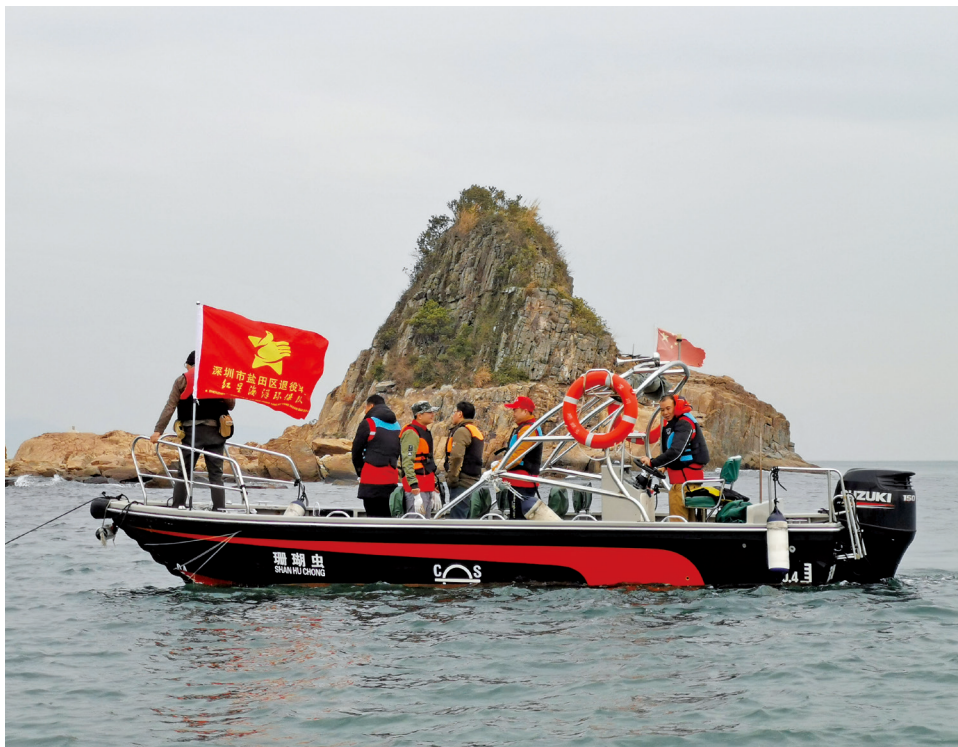
2021年1月11日，盐田区退役军人红星志愿服务专业队在盐田区梅沙海域开展海洋环保志愿服务活动。

从繁华都市，到村头巷尾，沿着黄河之畔、长江之滨，在抢险救援、疫情防控、社会治理、乡村振兴等领域，退役军人志愿服务的“铁军”如雨后春笋般拔地而起，迅速壮大。如今，全国有超过10万个退役军人志愿服务组织、超过140万名退役军人志愿者，构筑起奉献报国、为民服务的“同心圆”，打造出“中国退役军人