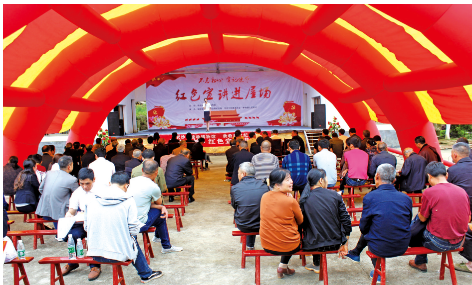
秋收起义文家市会师纪念馆讲解员走进社区乡村开展志愿服务宣讲。

发动社会力量参与志愿服务讲解,讲好秋收起义光荣历史,不断壮大志愿服务讲解队伍,目前志愿者讲解员已达1200多名。