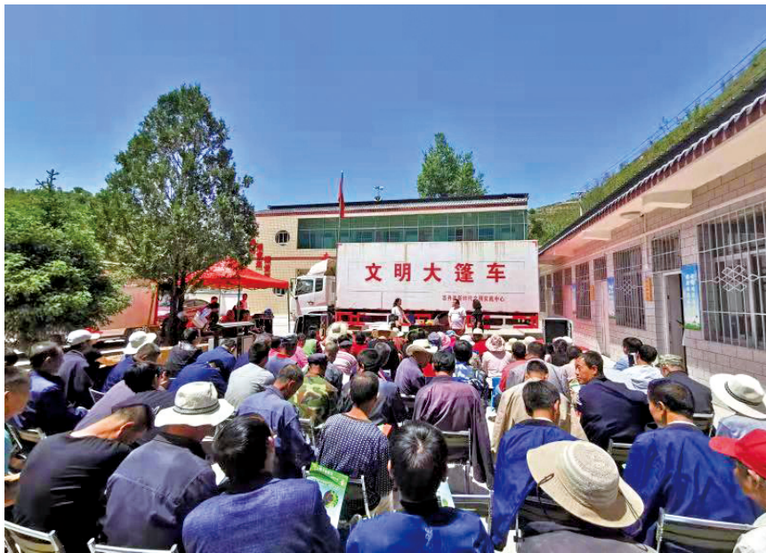
延安市“文明大篷车”志愿服务走进志丹县纸坊村。

人”为主题,启动“小小讲解员”培育活动,让红色革命文化走进校园、让中小学生走进革命旧址,在中小学校精心选拔、指导培训一批优秀学生,组成“小小讲解团”,利用寒暑假时间深入旧址,为来延安的游客讲述延安故事,赓续红色血脉,传承红色基因,弘扬延安精神。延安市制定《党史小小讲解员工作方案》,全面推广“小小讲解员”模式,指导全市中小学生当小小讲解员,熟知会讲党史故事和习语金句,向景区游客宣讲、向老师同学宣讲、向家庭成员宣讲,共同交流学习。29年来,延安市累计培养“小小讲解员”4.7万名,开展讲解活动10余万场次,接待游客约6500多万人。