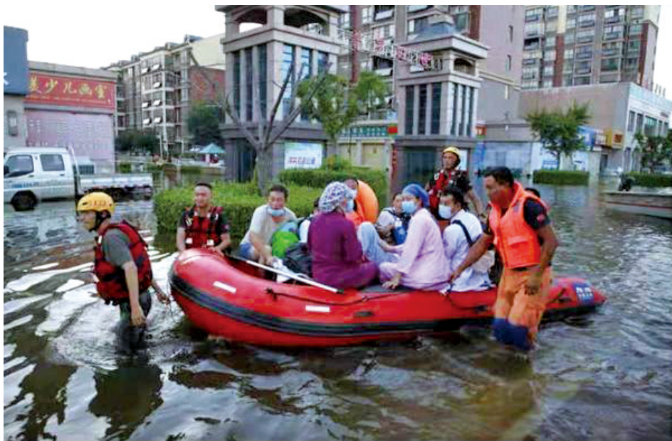
广东省佛山市菠萝救援队在郑州救援受困群众。

立省、市、县（市、区）、乡镇（街道）、村（社区）“五级”防汛救灾志愿服务工作体系，全面动员新时代文明实践中心、所、站的志愿者、志愿服务组织，迅速投入抗洪抢险、安置群众、分发物资、生活保障等志愿服务。建立“河南省防汛救灾文明实践志愿服务群”“省市联动防汛救灾群”“新乡救灾物资协调群”“优秀志愿者宣传群”4个工作群，扁平化统筹指挥、调度各方志愿服务力量，不断有序向受灾地区派遣志愿者救援队、服务队，送去大批