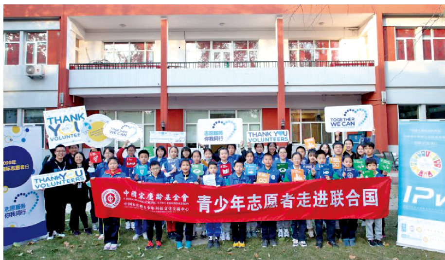
青少年志愿者来到联合国开发计划署驻华代表处开展交流活动。

中国宋庆龄青少年科技文化交流中心建立首都学雷锋志愿服务示范站、“新时代文明实践基地”。结合主责主业,以展教活动为载体,强化志愿者主体力量,