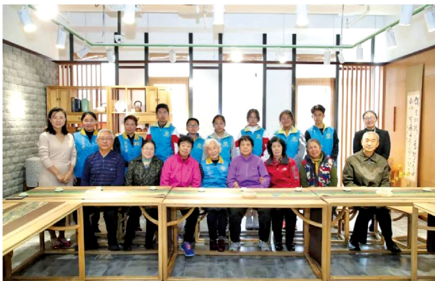
青少年志愿者为老人提供茶道体验志愿服务。

中国宋庆龄青少年科技文化交流中心与北京市教育委员会联合建设“北京市中小学综合实践活动课程研究开发中心”,完善实践育人体系,巩固协同育人机制,联动教育专家资源,合力研发包括志愿服务在内的中小學生综合实践活动课程。以志愿服务项目活动经验为基础,优化、完善课程要素,开放参与机制,尝试形成“课程进校园、学生进中心”的中小学志愿服务综合实践活动课程生态。课程研发(下转第44页)