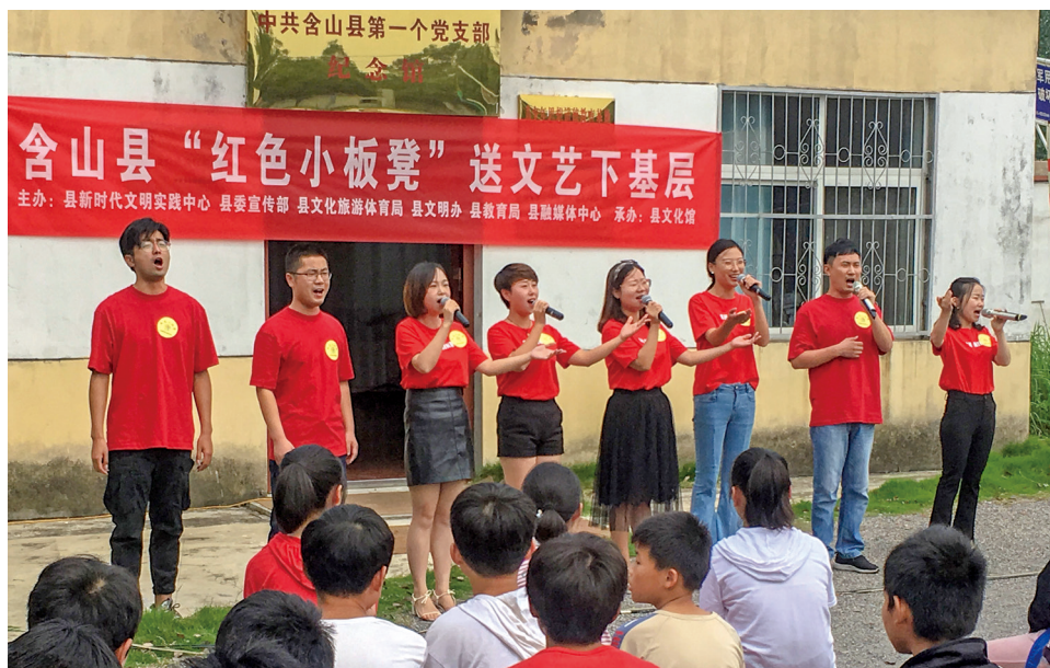
含山县新时代文明实践中心开展“红色小板凳”活动,通过文艺形式宣传传播党的理论思想。

党员志愿者先锋引领。在以县(区)、乡镇(街道)、村(社区)为基本单元的三级新时代文明实践组织设置中,各级党组织主要负责同志同时担任中心(所、