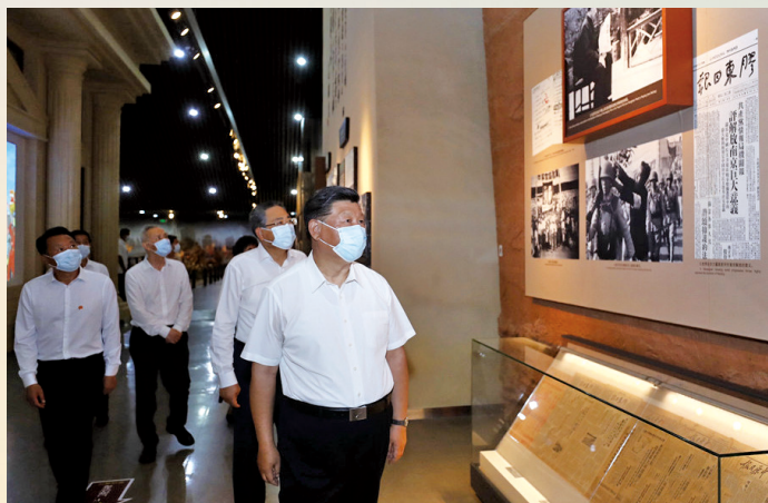
8月19日下午,习近平在合肥市参观渡江战役纪念馆,重温革命历史,缅怀革命先辈的丰功伟绩。