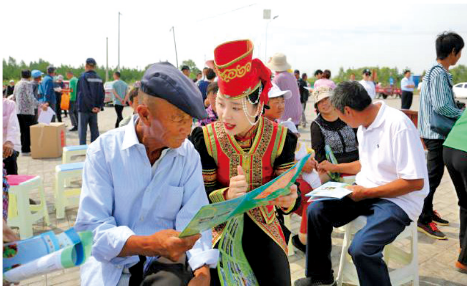
乌兰牧骑深入到新时代文明实践所,在开展演出服务的同时,开展志愿服务。

观融入贯穿于中国特色志愿服务全过程。60多年来,乌兰牧骑为人民送去欢乐和文明,送去向上向善的正能量,以自己的实际行动践行了社会主流价值。我们始终坚持把社会主义核心价值观作为志愿服务的“根”与“魂”,在志愿服务中熔铸和释放理想信念、爱心善意、责任担当,传承中华文化厚德仁爱、助人为乐、扶贫济困等高尚价值理念。一是深入推进新时代爱国主义教育。出台《贯彻落实〈新时代爱国主义教育实施纲要〉若干措施》,在各高校开展“爱祖国、担大任、做新人”主题实践活动,在全区各类校园班级悬挂国旗和组建国旗班志愿服务队,在全社会结合重大节庆广泛开展“同升国旗、同唱国歌”活动。以“爱祖国、家乡美”为主题,弘扬红色文化,开展红色旅游、美丽家园游等活动,引导人们听红色故事、观城乡新貌、看身边变化、增家国情怀。二是深入开展新时代文明实践内蒙古“十大行动”。发挥各级文明委成员单位、文明单位作用,围绕12类重点群体,明确“1+1+N”的工作模式,即1个牵头单位抓1个重点群体、推进N项具体工作,深入推进学习教育、爱国爱乡、遵规守法、礼仪礼节、爱岗敬业、诚信友善、孝老爱亲、健康生活、生态文明、志愿服务“十大行动”。比如,针对城镇居民,由民政部门牵头,开展“邻里守望、互助关爱”等活动,践行守望相助理念,构建友善社区邻里关系;针对农牧民,由农牧业部门牵头,开展“守村规、改陋习、重诚信、讲互助”等活动,组织诚信村(嘎查)、诚信户评选,