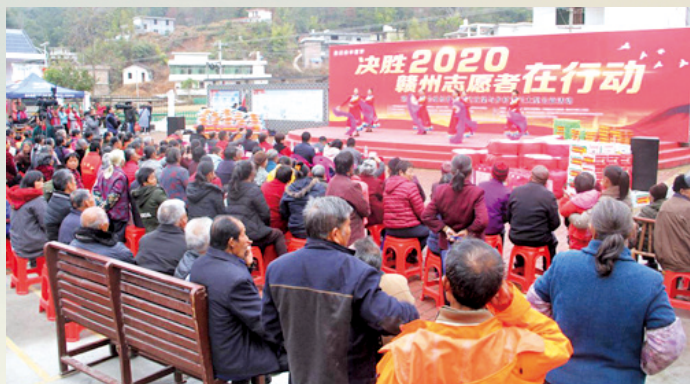
江西省赣州市开展志愿服务助力脱贫攻坚与乡村振兴项目。

志愿者的微笑,是城市乡村最好的名片。作为新时代的特征之一,志愿服务工作越来越深入到社会生活的方方面面。“我奉献、我服务、我快乐”,已成为广大志愿者发自内心的真诚心愿。近来,全国各地区、各行业的志愿者们开展了丰富多彩的志愿服务活动,内容涉及脱贫攻坚、社会治理、送医送药等各个方面。这里选登一组照片,展现志愿者们弘扬新风、服务社会、温暖他人的动人风采。