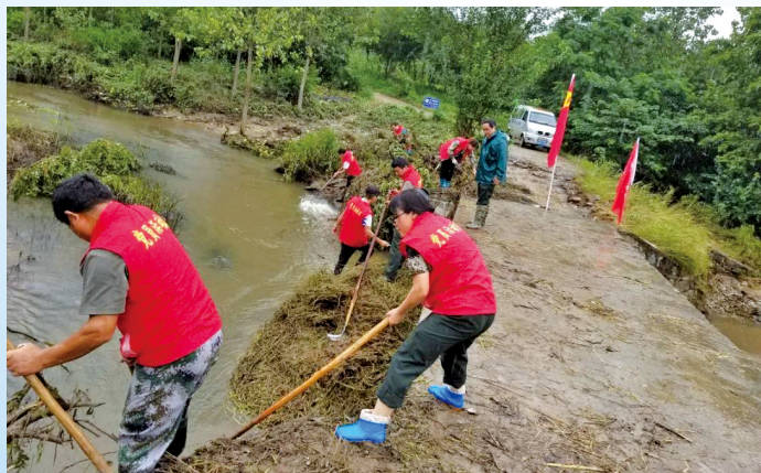
安徽省滁州市党员志愿者在清理河道。