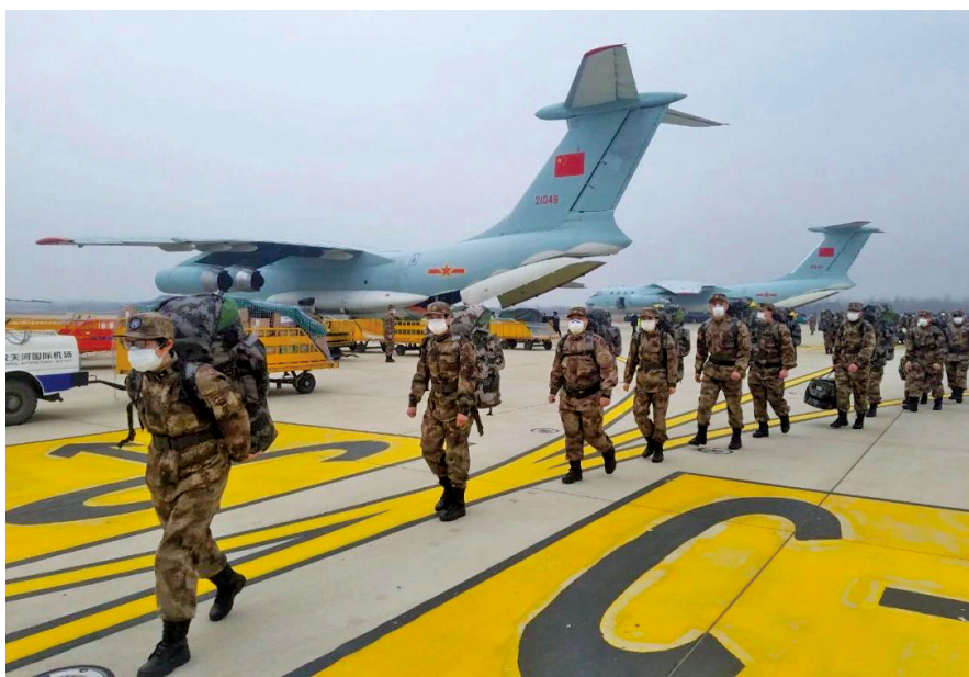
1400名军医驰援火神山。