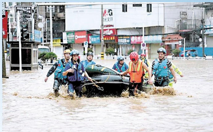
湖北省专业志愿服务救援队在防汛抢险中承担了水域救援、山地搜救等任务。