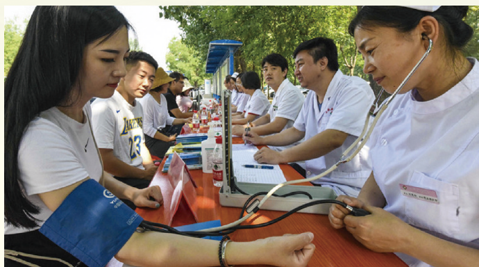
河北省文安县卫生医疗志愿者服务支队冒着酷暑炎热,在文安县森林公园为居民开展义诊活动。