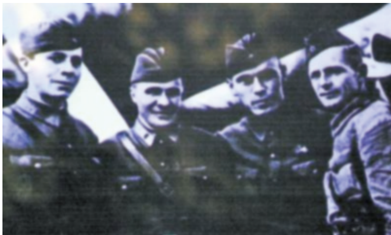
苏联志愿航空队飞行员在兰州机场留影。

10月14日,是一个可怕的日子,库里申科率领大队起飞了。下午2点,在武汉上空,他们同日军的梅塞斯特战斗机展开了生死搏斗。在这场恶战中,苏联