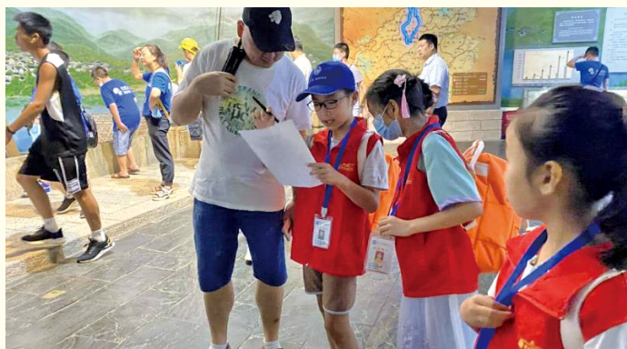
在中国徽州文化博物馆,暑期开展“小小义务讲解员”活动,培养中小学生的志愿服务意识和社会责任担当。