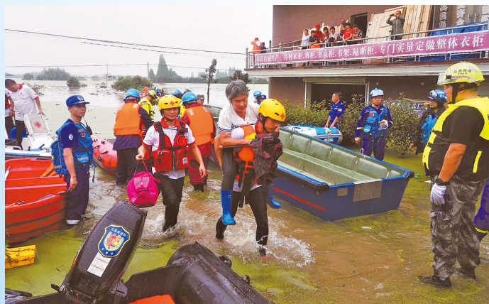
全国各地红十字会工作人员、志愿者奔赴抗洪救灾一线，帮助转移受灾群众。