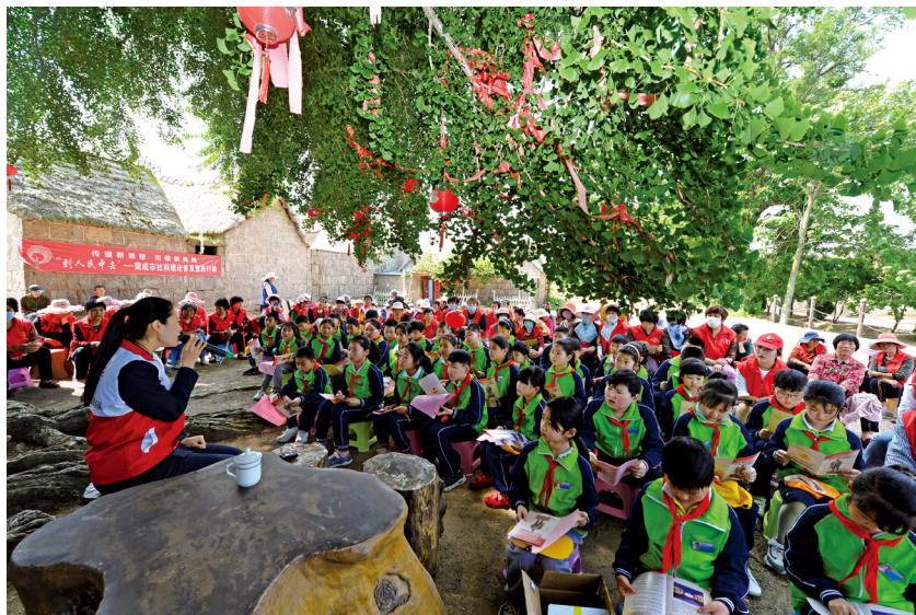
开展“银杏树下传习语”社科理论宣讲活动。

(原载7月27日《人民日报》,标题有改动。记者原韬雄、戴林峰、程焕、窦瀚洋、王锦涛)