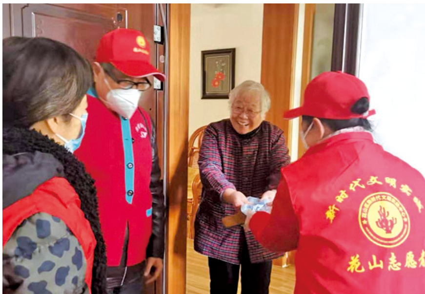
2020年防控新冠肺炎疫情期间,马鞍山市新时代文明实践志愿者为出行不便的老人送药上门。