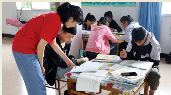
重庆市垫江县开展“摘帽”后“我们一起奔小康”志愿服务活动。(来源:重庆文明网)