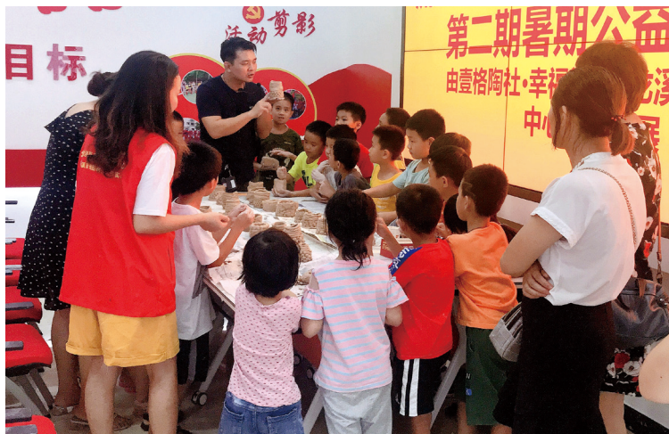
博罗县龙溪街道实践所举办“留守流动本地娃 手牵手齐哈哈”暑期陶艺班。

整合“十中心三平台”资源,特别是实践中心(所、站、点)与各级党群服务中心阵地实现高度融合,机制共建、阵地共用、队伍共管、资源共享、活动共联,最大限度发挥资源使用效益,打造便民式、多元化、共享型、精准化程度高的“大中心”。“十中心”包括:新时代文明实践中心、党群服务中心、综治维稳中心、行政服务中心、综合文化服务中心、志愿服务促进中心、社会组织孵化中心、长者服务中心、职工服务中心、社会心理服务中心;“三平台”包括:融媒体中心宣传平台、学习强国学习平台、志愿博罗信息平台。