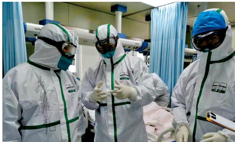
新冠肺炎疫情防控期间,张伯礼(左)带队奋战在武汉方舱医院,图为他正在和助手讨论患者病情。

张哈拉深情地谈到:“为需要救助的贫困群众做些事,一直是我的愿望。第一次走上讲台,是在甘南碌曲的藏医院,当地的医生是我的学生。那里的医疗知识和技术极为匮乏,我实现了一个志愿者