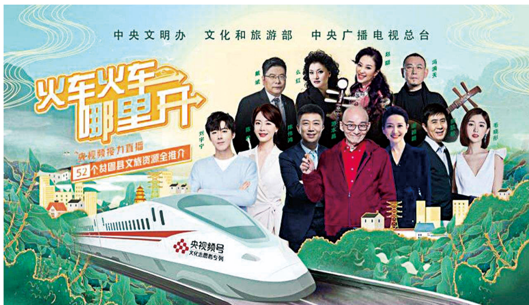
央视频·文化志愿者专列“乘组”，由著名艺术家和央视主持人等文化志愿者组成。

晓的表演艺术家游本昌、创作《我爱你塞北的雪》的著名作曲家刘锡津、早年因主演《庐山恋》而走红的著名影视演员郭凯敏等37名知名艺术家，积极响应、踊跃参加。中央歌剧院院长刘云志、中央芭蕾舞团团长冯英、中央民族乐团副团长唐峰和赵聪、中国交响乐团副团长李心草等艺术院团领导积极参加，争当脱贫攻坚文化志愿者。当红一线明星毛晓彤、刘宇宁等作为新生代志愿者也来到直播间，为贫困地区文旅产品、非遗产品当“推荐官”。