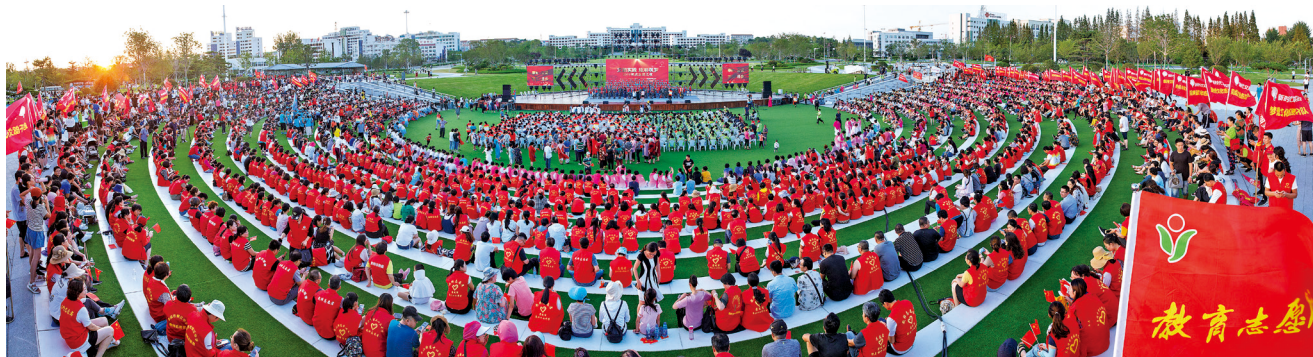
“文明实践 炫彩筑梦”荣成志愿之夜现场。

动指挥中心、社会信用中心、融媒体中心、社会组织孵化中心等社会管理部门职能,统筹爱国主义教育基地、博物馆、文化馆、图书馆、少年宫等各类阵地资源,形成部门联动、阵地共享、互促共融的文明实践工作格局。