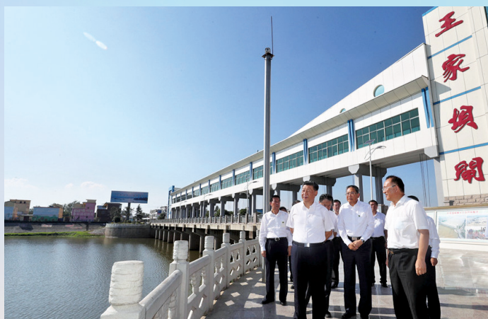
8月18日下午,习近平在阜阳市阜南县王家坝闸考察,了解安徽省防汛工作及王家坝开闸分洪情况。