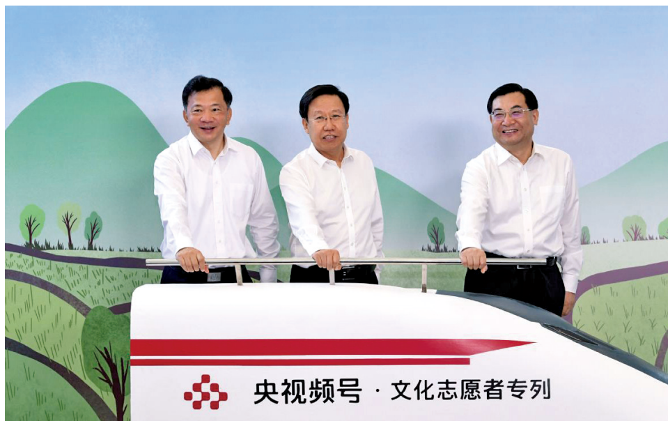
8月23日,在活动现场,王晓晖、胡和平、慎海雄为“专列”启动“引擎”。

本次活动以脱贫攻坚为工作重点,面向全国尚未摘帽的52个贫困县、1113个贫困村,重点推介这些贫困县的文化旅游资源、特色美食、非遗产品等。活动前,主办方发动各贫困县推荐“一县一品”,形成了52个特色产品名录,如广西三江县的三江茶、四川布拖县的乌洋芋、贵州纳雍县的滚山鸡、云南泸水市的阿客哆咪咖啡、甘肃礼县的苹果、宁夏西吉县的马铃薯、新疆莎车县的巴旦木等。来自中国国家话剧院、中国东方演艺集团、中央歌剧院、中央民族乐团、中国交响乐团、中国煤矿文工团等部直属十大国家艺术院团的艺术家和总台主持人一起作为文化志愿者,将通过5G新媒体平台“央视频”和财经节目中心实现大小屏联动,连续开展10余场大型推介直播互