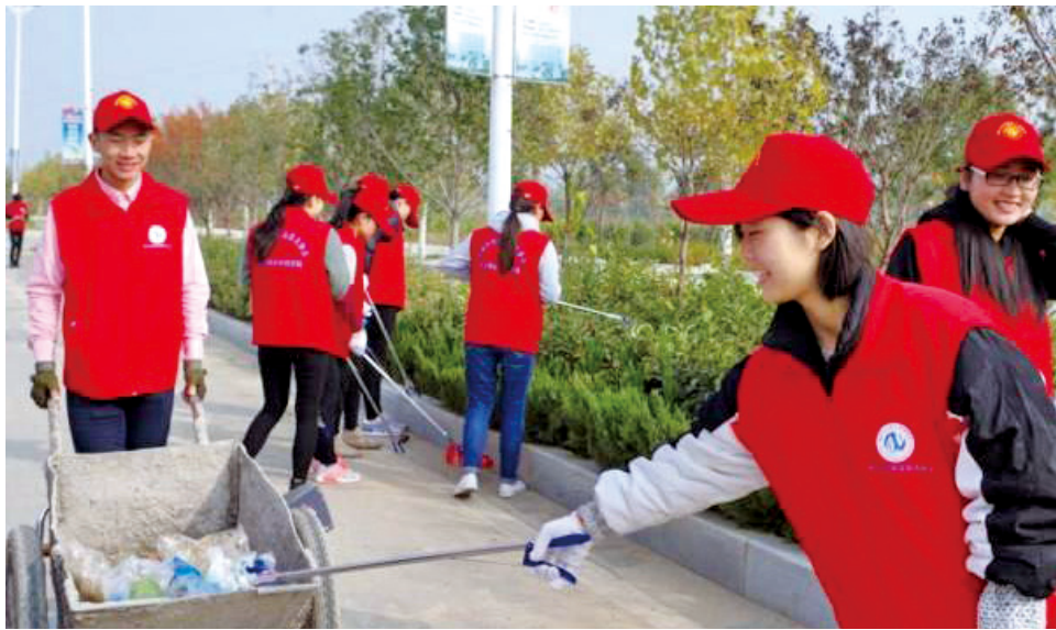
争当志愿者,争做志愿服务,正逐步成为广大青年志愿者的自觉行动。

在“志愿服务关爱行动”的示范带动下,全国参与新冠肺炎疫情防控注册志愿者达881万人,服务65万个城乡社区,是新中国成立以来投入注册志愿者人数最多、开展志愿服务项目最全、服务城乡社区范围最广、发