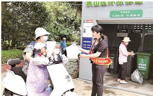
江苏省徐州市党员志愿者积极参与志愿服务。