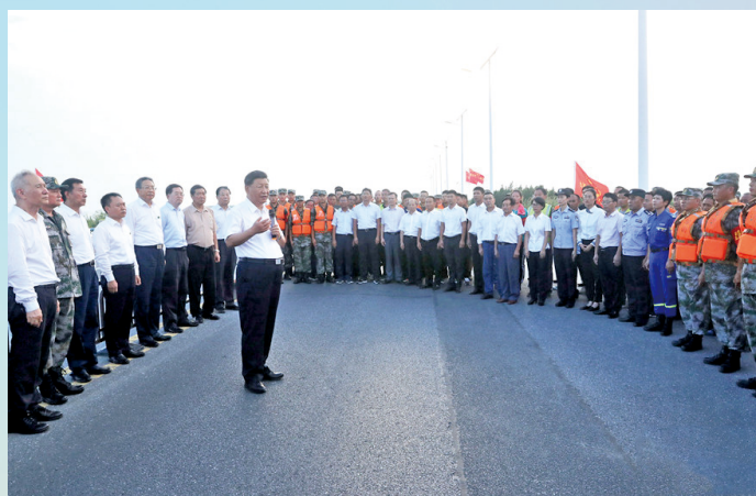
8月19日下午,习近平亲切看望慰问在防汛抗洪救灾斗争中牺牲同志的家属和奋战一线的抗洪军民。