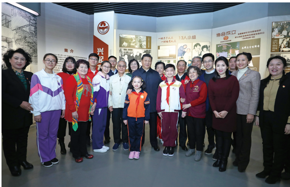
2019年1月17日上午，习近平总书记乘车来到天津市和平区新兴街朝阳里社区，走进社区志愿服务展馆。

习近平总书记高度重视志愿服务工作，作出一系列重要指示，强调志愿服务是社会文明进步的重要标志，是广大志愿者奉献爱心的重要渠道，志愿者事业要同实现“两个一百年”奋斗目标、同建设社会主义现代