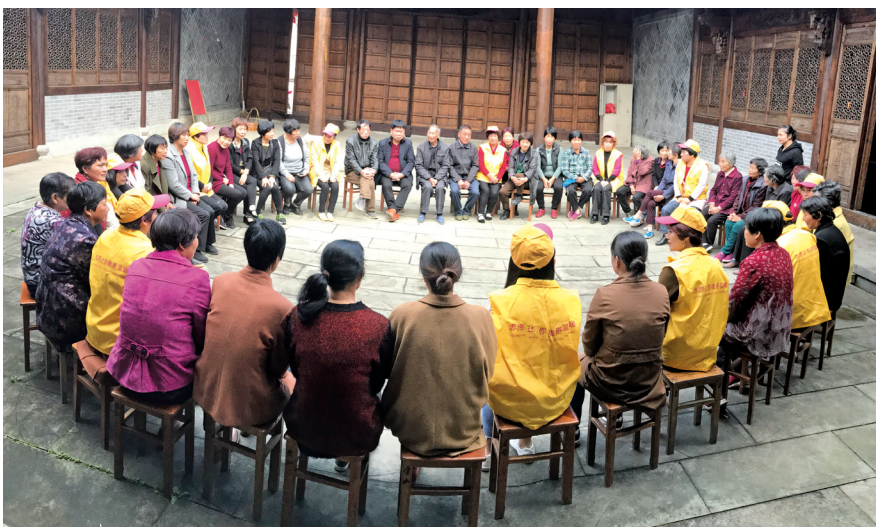
诸暨市岭北镇的“板凳课堂”让党的理论飞入寻常百姓家。

线上线下双向拓展,构建起全覆盖、多层次、分众化的“文明实践红色讲坛”,推动党的创新理论“飞入寻常百姓家”。一是做强新媒体宣传平台。利用掌握近300万用户的诸暨发布、文明诸暨、爱诸暨等新媒体平台,开设“学习时间”“宣讲家”等理论专栏,打造群众的身边课堂、手机学堂。二是做精通俗传播产品。创设微视频、微音频、H5、动漫等理论产品,寓教于乐。推出系列短视频《暨阳微时论》,邀请身边人,以亲身实践谈感受,通过真情讲述和鲜活的场景画面生动诠释,