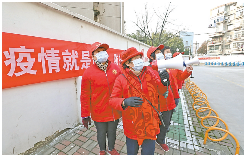
社区志愿者手提“小喇叭”宣传疫情防控。

贯彻“本地化、社区化、组织化、安全第一”原则，遵循需求、目标、绩效、能力等导向模式，重点围绕当地开展疫情防控服务活动。通过有顶层设计、统筹、统管、调度的志愿者价值链，有序有力有效运作社会资源力量，标志中国志愿走向成熟。