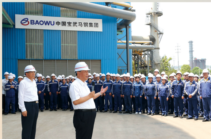
8月19日上午,习近平在马鞍山市中国宝武马钢集团,同企业劳动模范、工人代表亲切交流。