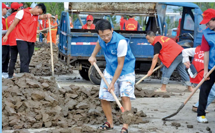
四川省宜宾市青年志愿者在为公园步道清淤。