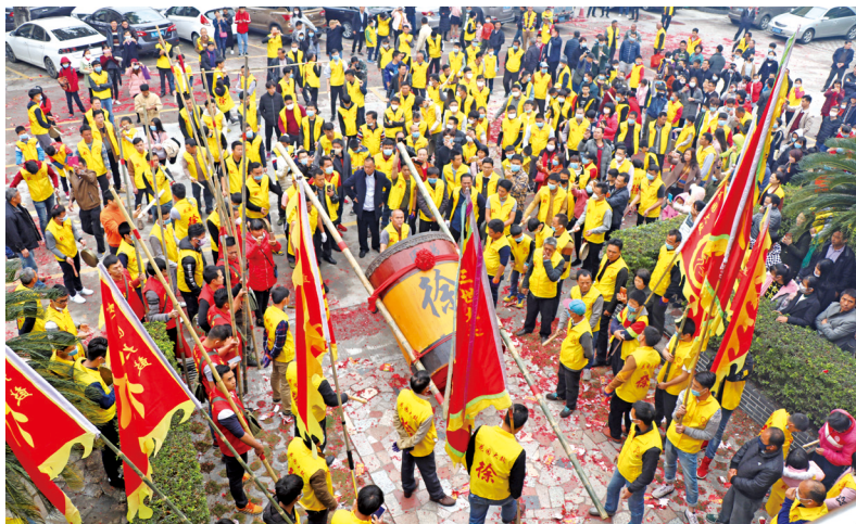
博罗县龙华镇实践所举办龙华大鼓节庆活动。

阵地资源整合“十中心”。实行党委政府统筹全局,打破部门壁垒,促进资源联通互通,形成“中心吹哨、部门动员、各方参与”的工作机制,构建县、镇、村三级贯通,中心、所、站密切联动的工作格局。