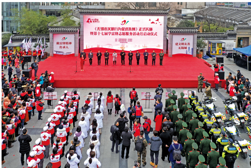
江苏省无锡市学雷锋志愿服务活动启动仪式。

全国各地不断加强志愿服务地方性立法,进一步指导和规范志愿服务工作。大力倡导“奉献、友爱、互助、进步”的志愿精神,增强公民志愿服务意识,鼓励志愿服务活动,维护志愿者、志愿服务组织和志愿服务对象的合法权益。不断健全完善志愿者招募注册、培训管理、服务记录和志愿者保险等一系列政策制度,加大志愿服务表彰、激励和回馈工作力度。与此同时,各地还配套出台了相关《意见》《办法》《细则》等,如《江西省引导支持社会组织和社会工作及志愿服务力量参与脱贫攻坚的实施意见》、河北省《关于全省共产党员广泛参与志愿服务活动的意见》等,有效地推动了志愿服务事业的发展。