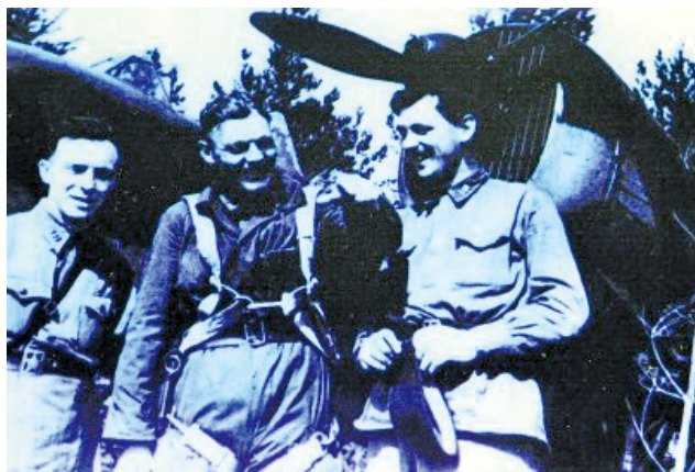
从蓝天凯旋的苏联志愿队飞行员。

库里申科的事迹迅速传遍抗战中的中国。而在当时的苏联,援华志愿人员却是保密的,家人只知道他们奉命执行秘密任务,至于具体去向则一无所知。库里申科在给妻子的家书中也这样写道:“我调到东方的一个地区工作。这里人对我很好。我就像生活在家乡一样。”几个月后,库里申科的妻子接到一份军人阵亡通知书,上面写道:“格里戈里·阿基莫维奇·库里申科同志在执行政府任务时牺牲。”至于牺牲的具体经过和葬身地方,全然不知。