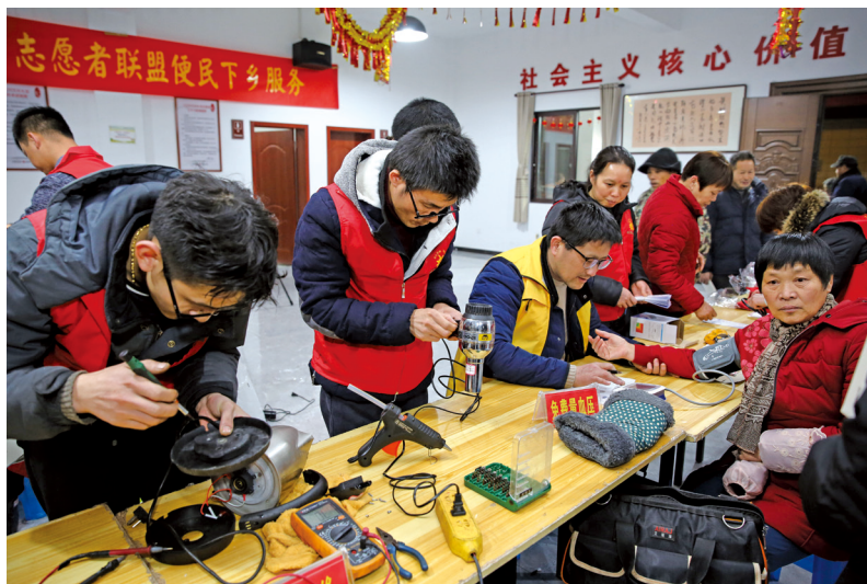
志愿者帮助群众修理家电。

聚焦聚力强信心、聚民心、暖人心、筑同心,做好人文关怀加法、移风易俗减法、“枫桥经验”乘法,形成