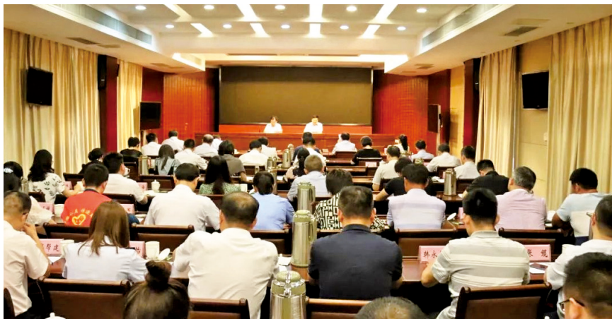
江苏省组织收听收看全国推进学雷锋志愿服务工作电视电话会议并召开续会。

《通知》强调,希望各类典型珍惜荣誉、再接再厉,立足新时代、展现新作为,大力弘扬雷锋精神、志愿精神,始终做社会主义核心价值观的模范践行者和为他人送温暖、为社会作贡献的先行者、引领者。各地各部门要以宣传推选活动为契机,紧紧围绕服务决战脱贫攻坚、决胜全面小康这条工作主线,以推进新时代文明实践中心建设为重点,加强组织领导,推动学雷锋志愿服务活动广泛持续深入开展,为实现“两个一百年”奋斗目标、实现中华民族伟大复兴的中国梦作出更大贡献。●