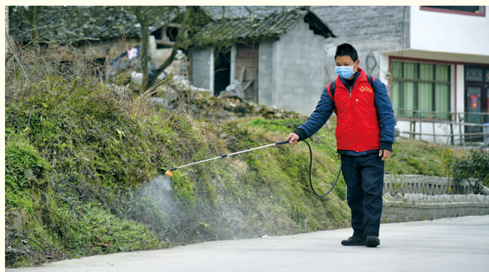
在贵州龙里山乡,3万多名“萤火虫”志愿者扮演着民情信息员、矛盾调解员、政策宣传员等角色。图为道路消杀现场。