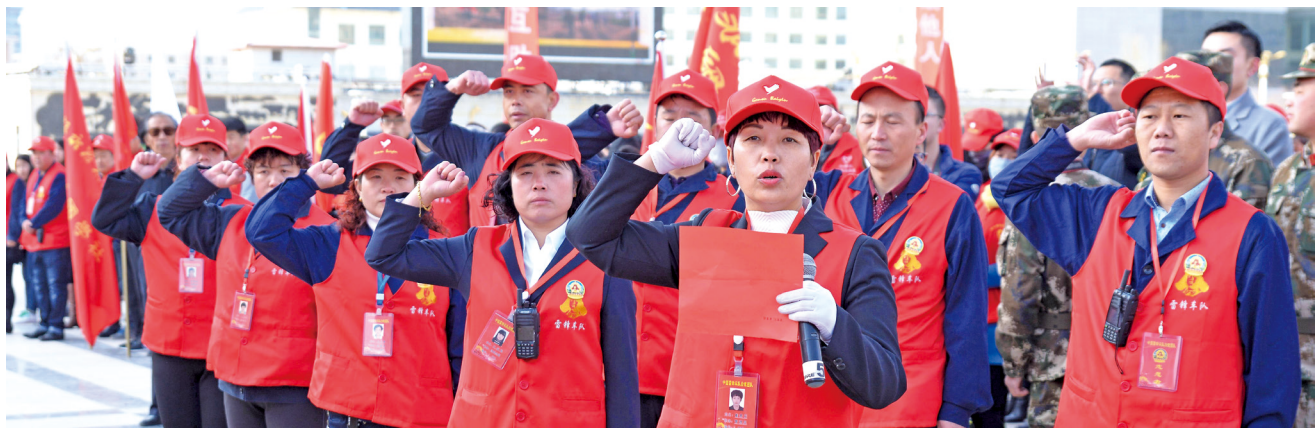
志愿者出征宣誓仪式。