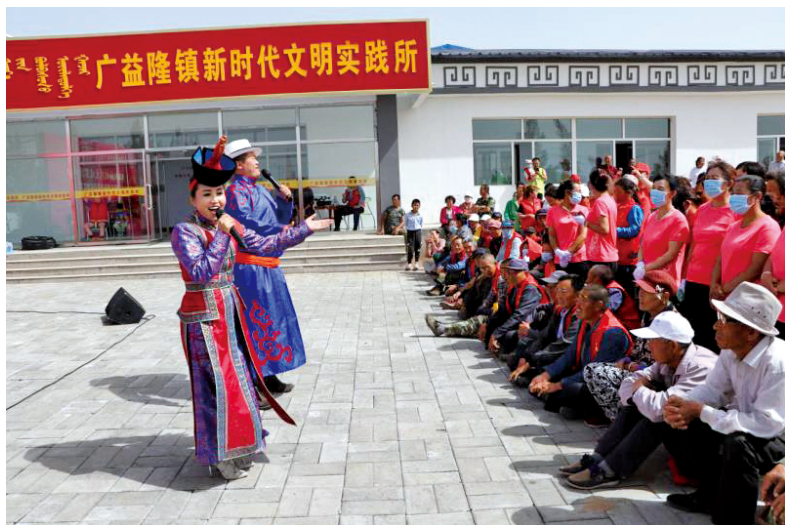
在“乌兰牧骑月·一切为了人民”主题活动中，乌兰牧骑队员来到文明实践所为农牧民演出。

第五，大力弘扬乌兰牧骑自觉快乐无偿为群众提供服务的社会主义、集体主义精神，积极培育志愿文化，推动从“要我参加”到“我要参加”的转变。 60多年来，乌兰牧骑始终坚持社会主义方向，坚持集体建队、集体演出、集体劳动、集体服务。始终坚持在全社会大力弘扬乌兰牧骑精神，充分调动社会各界的积极性、主动性、创造性，为志愿服务注入源源不断的发展动力。一是组建“8+N”志愿服务队，按照乌兰牧骑一专多能、短小精悍的建队形式，组建理论政策宣讲、文化艺术服务、助学支教、医疗健身、科学普及、法律服务、卫生环保、扶贫帮困等8类常备队伍和N支具有自身特色和优势的志愿服务队伍。二是建立包联机制，文明委成员单位、文明单位包联新时代文明实践中心试点旗县、包联城镇社区、组建全区性志愿服务工作队，让机关干部走出大院、走进群众。三是建立嘉许激励机制，制定志愿服务嘉许激励奖励办法，建立以服务时长为基础、以各方评价为依据、以正向激励为目标的志愿服务评价体系；在农村牧区普遍建立“文明实践超市”，对志愿服务给予积分奖励；在各级各类媒体开设“文明实践在行动”专栏，营造志愿服务浓厚氛围。●