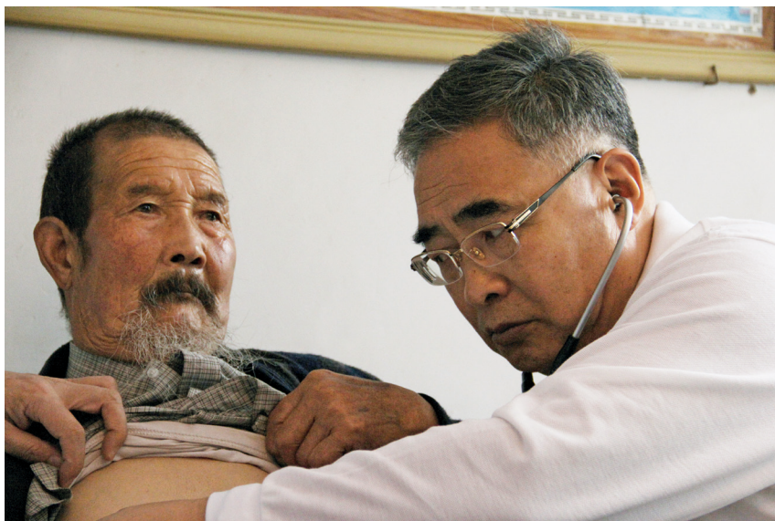
张伯礼在青海藏区为年过八旬的藏族老人义诊，这是老人第一次接受正规的检查治疗。