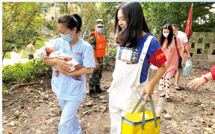
重庆市渝中区巾帼志愿者救出5名被困在月子中心的产妇和婴儿。