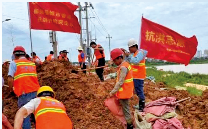
7月12日，中建一局华江公司组织“抗洪抢险先锋队”，赶赴江西省鄱阳县抗洪一线加固圩堤。

“沧海横流，方显出英雄本色”。今年入汛以来，全国多地暴雨频发，数百条江河发生超警戒线以上洪水，暴发多起山洪、泥石流地质灾害，严重威胁人民群众的生命财产安全。“人民至上！生命至上！”在严重的灾情面前，各地志愿者、志愿服务组织闻“汛”而动，在雨情、水情、灾情面前，他们奋不顾身，争分夺秒，冲向洪水，冲向灾区，紧急抢救灾民和财产，为灾民排忧解难，用无私和担当践行了“奉献、友爱、互助、进步”的志愿服务精神。