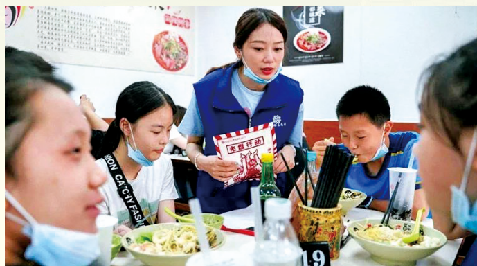
在四川成都市“成都志愿者 喊你吃光光”活动携手“春熙嬢嬢”志愿服务队宣传“光盘行动”。