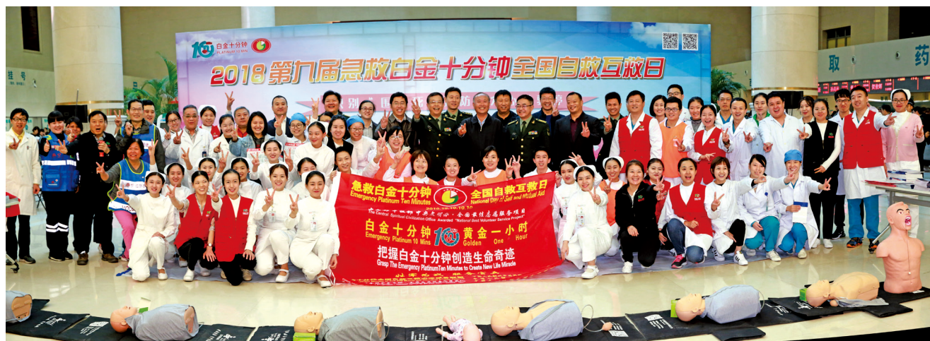
2018年10月10日“第九届急救白金十分钟全国自救互救日”活动现场。