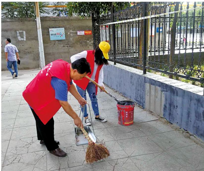
河北省邢台市襄都区为创建国家级文明城市 积极组织开展群众性志愿服务活动。图为区文联组织志愿者在砂轮厂小区和方圆小区帮助社区清扫垃圾,为美化城市贡献力量。

三是把继承中华文明与吸纳人类先进文化结合起来,促进志愿服务事业。建设中国特色社会主义已经进入新时代,面对新的机遇和挑战,如何承担起时代赋予的历史使命,传承弘扬中华文化的精髓血脉、汲取吸纳世界文明的共同价值、宣扬展示时代发展的价值取向,是中国特色志愿服务必须直面和回答的时代课题。首先,中华优秀传统文化历史悠久、内涵丰富、博大精深,而中国特色志愿服务精神是凝聚其精髓的智慧瑰宝。对于中国特色志愿服务来说,传承弘扬中华优秀传统文化,就是汲取精华、剔除糟粕,将中华文明在坚定文化自信中赓续传承;在具体工作中,就是聚焦奉献、友爱、互助、进步,使中国特色志愿服务精神在新时代的伟大社会实践中发扬光大。其次,世界文明共同价值汇集东西、成果丰硕、影响深远。对于中国特色志愿服务来说,必须充分汲取吸纳世界文明宝藏的共同价值,来丰富其深远内涵。一方面,要辩证的学习共同价值所蕴含的科学精神,将其移植到中华民族的土