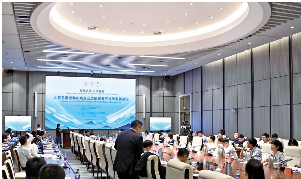
9月21日“双奥之城 志愿有我”北京冬奥会和冬残奥会志愿服务可持续发展论坛在北京举办 图为论坛会场。

陆士楨、张翼、白岩松等国内志愿服务领域研究专家代表、京冀两地志愿服务组织代表等，围绕迎冬奥、办冬奥和后冬奥等领域，为北京冬奥会和冬残奥会志愿服务可持续发展工作建言献策，发表了很多建设性、创新性意见。