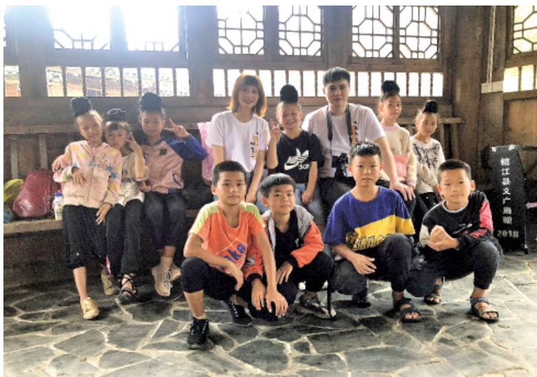
文艺志愿者在贵州省参加直播推介活动。

作为中央文明办、文化和旅游部共同实施的“春雨工程”全国示范性志愿服务活动的重要组成部分,“央视频号·文化志愿者专列”活动继续创造性地推出大型融媒体直播节目《火车火车哪里开》,充分发挥国家艺术院团的人才资源优势 and 中央广播电视总台的国家平台优势,将“央视频”号动车与中央文明办、文化和旅游部推出的文化志愿者扶贫行动进行深度结合,以移动直播+短视频的呈现方式向受众全面展示扶贫成就、讲述扶贫故事、弘扬扶贫精神,让精准扶贫插上了新媒体的翅膀。