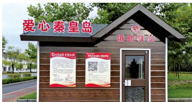
秦皇岛市便民、温馨、靓丽的志愿服务爱心援助驿站。

作为秦皇岛“与爱同行 守望相助”专项行动的一部分，爱心捐助驿站建设主要是在各县区主城区的中心广场、公园、主干道两侧等醒目地段设置一类驿站；在困难