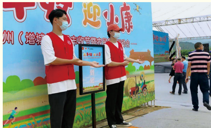
广州华立科技职业学院志愿者为增城区农民丰收节活动提供会务志愿服务。