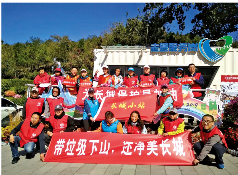
2019年10月,八达岭管委会团委和“长城小站”志愿服务队合办“为长城保护员加油”活动。

二是建设长城公共数据库。聚沙成塔,集腋成裘,让各级有志于参与长城保护的人们能分享到基础数据,降低进入门槛,同时为专业工作者提供智慧补充。截至目前,长城小站对外开放的公共数据库共有“中国