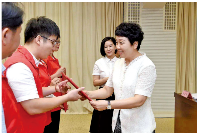
范晓莉为广西2019年度全国学雷锋志愿服务“四个100”先进典型和疫情防控最美志愿者颁奖。

中央和自治区党委对学雷锋志愿服务高度重视，广西各地各部门要从价值导向、社会治理、目标追求层面不断深化对新时代志愿服务重大意义的认识；坚持围绕中心、服务大局，加强组织领导和统筹协调，学习宣传贯彻《广西壮族自治区志愿服务条例》，加强志愿服务项目化、阵地化、网络化等方面建设，努力开创广西志愿服务事业新局面。