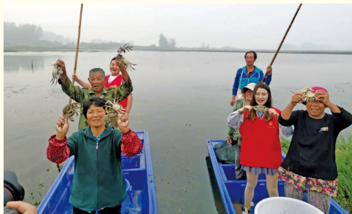
江苏泗阳县裴圩镇志愿者走上渔船帮助蟹农捕蟹