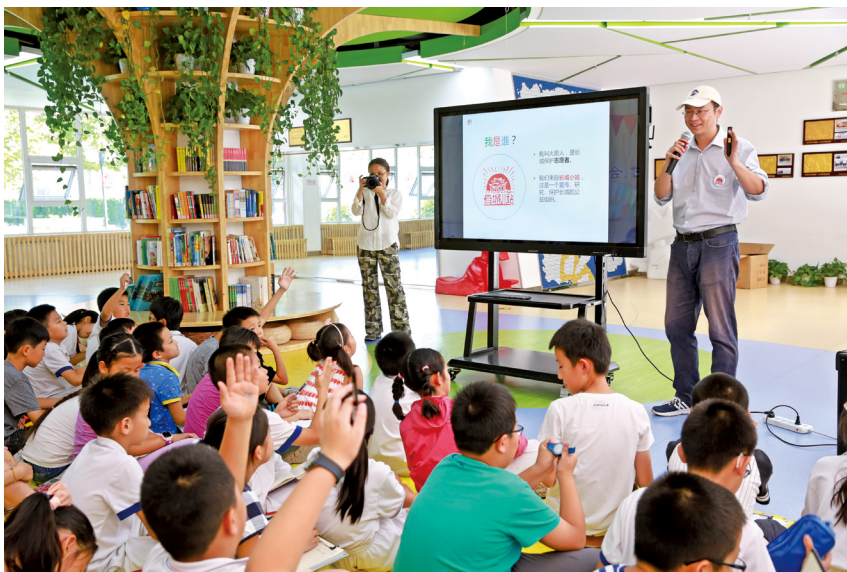
“长城小站”志愿服务队讲师在北京学校开设长城公益课堂。

致力于社会力量参与文物保护利用,组织论坛,并出版了多册文集,做了大量引领工作。但总的来看,志愿者参与长城保护还没有规章制度可循。有些长城所在地的领导意识比较超前,希望社会力量参与,但由于无章可循,工作无法得到实质性推进。