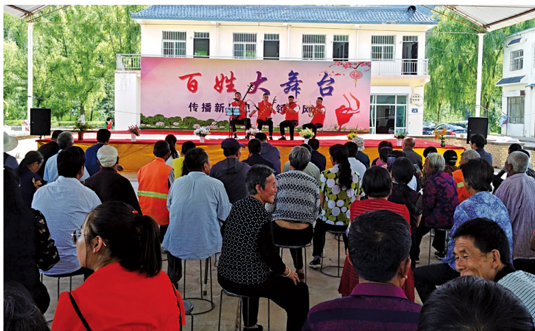
“百姓大舞台”志愿者表演陕北说书。

针对宣讲志愿者机关干部多百姓名嘴少、单向宣讲多互动参与少、照本宣科多结合群众实际少等问题,