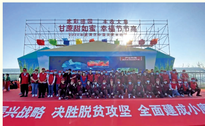
天津武清区青年志愿者参与丰收节活动 助力决胜脱贫攻坚。