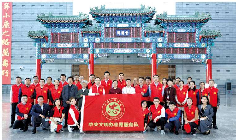
中央文明办志愿服务队在首都博物馆举行成立仪式。

通过参加此次活动,中央文明办党员志愿者一致认为,志愿服务是社会文明进步的重要标志,是新时代开展精神文明建设、践行群众路线的重要载体,作为中央文明办的工作人员,应率先示范,积极主动投身文明实践、开展志愿服务活动,发挥共产党员的先锋模范作用,践行全心全意为人民服务的宗旨。大家表示,将自觉遵守志愿服务队章程,各尽所能、各展所长,积极参加志愿服务队各项活动,把奉献、友爱、互助、进步的志愿精神落实到具体行动中。●