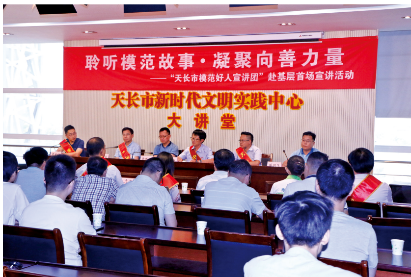
天长市文明实践中心组织开展模范好人进基层宣讲活动。

为更好发挥“三个导向”推动作用,今年,天长市重点实施文明实践“133”行动计划,旨在让志愿服务项