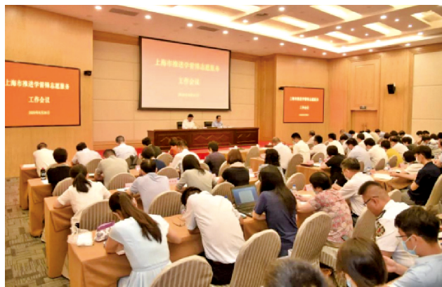
上海市召开推进学雷锋志愿服务工作会议。

上海是党的诞生地,传承红色文化,传播志愿精神,开展红色文化传播志愿服务,为诠释共产党人的初心使命注入了新的活力,使红色文化传播志愿者成为上海这座城市的一道靓丽风景线。上海市各区各部门要依托新时代文明实践中心建设,更好推动志愿服务在申城蔚然成风。要聚焦服务保障“三大任务、一大平台”以及制止餐饮浪费、爱国卫生、垃圾分类、乡村振兴等重点工作,做好优质资源跨界整合,强化条块项