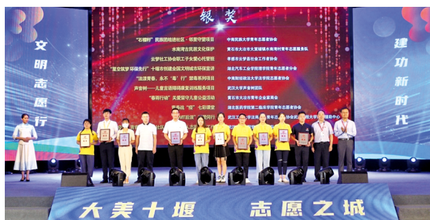
2020年湖北志愿服务项目大赛现场。

“人生就是一种召唤，让志愿点亮人生。”在分享交流环节，与会嘉宾围绕“志愿服务赋能社区治理”等主题与志愿者交流互动。在十堰市博物馆广场，来自全省的50个优秀志愿服务项目与本地部分志愿服务组织一道集中展演，吸引了近万名十堰市民“志愿赶集”。