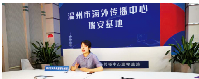
浙江温州海外青年宣讲团成员连线海外侨胞开展志愿宣讲活动。