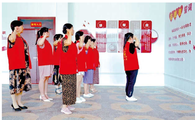
鄂州市鄂城区汀祖镇文化艺术志愿服务队员宣誓助力文明创建。

暖意在延伸，文明在传递。今年6月，汀祖镇新时代文明实践所挂牌成立，建立了9支各具特色的志愿