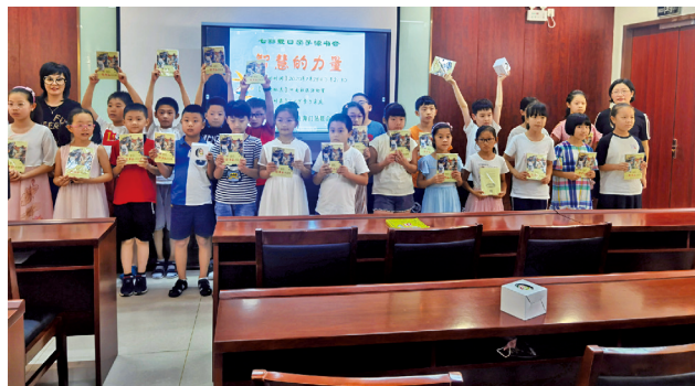
南通市海门区委编办“编忙编乐”志愿服务队为孩子们开展“智慧的力量”共读绘本活动。

海门区委编办志愿服务活动不仅仅体现在亲子公益上,还体现在对经济薄弱村居以及贫困群体的关心