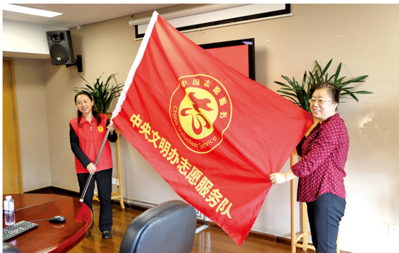
中宣部机关党委向中央文明办志愿服务队授旗。

本刊讯 为认真贯彻落实习近平总书记关于志愿服务工作的系列重要指示精神,巩固深化“不忘初心、牢记使命”主题教育成果,不断加强党员干部理想信念教育和党性教育,通过志愿服务为群众解决实际问题,中央文明办党支部成立志愿服务队,9月29日在首都博物馆举办了第一次活动。