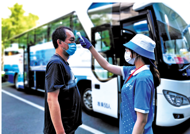
为做好疫情防控工作 服贸会体温检测志愿者为嘉宾提供服务。