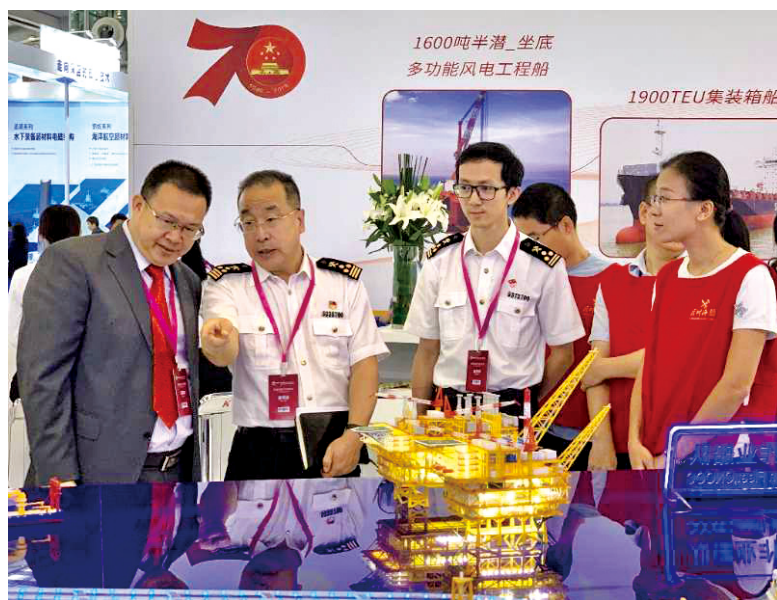
深圳海关为中国海洋经济博览会提供现场政策宣传志愿服务。

参与社会治理，做“文明使者”。 立足海关职能，以“学雷锋纪念日”、国际禁毒日、世界野生动物保护日、世界知识产权日、爱国卫生月等重要时间节点为契机，广泛开展“禁毒宣讲进校园”“普法大家行”“食品安全体验日”“口岸防疫宣传”等志愿服务行动。参与地方政府的文明创建，开展文明交通劝导、文明旅游宣传、大型赛会保障等志愿活动，让志愿服务融入区域城市文明发展，激发志愿者的荣誉感和获得感。厦门海关为“第28届中国金鸡百花电影节”“金砖国家厦门会晤”“九八投洽会”等重大活动多次提供专项通关志愿服务，并针对关区进出境旅客尤其是台胞和东南亚侨胞中使用闽南语比例较高的情况，在旅检现场打造“闽南语·志愿亲”项目，为往来旅客提供乡音服务。参与社区志愿服务，开展“邻里守望”互助活动，围绕社区居民所需开展针对性服务。疫情期间，海关志愿者主动走进社区，积极为社会各界群众提供卫生防疫政策宣讲、设卡测温、