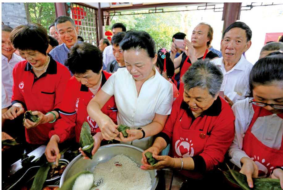
今年端午节前夕,全国学雷锋活动示范点——温州红日亭开展“万‘粽’一心”端午爱心粽分发活动,图为市领导率领志愿者参加活动。