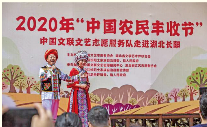
中国文联文艺志愿服务队走进湖北长阳县。

经党中央批准、国务院批复,自2018年起,我国将每年秋分节气日设立为“中国农民丰收节”,这是第一个国家层面专门为农民设立的节日。2020年9月23日,在第三个“中国农民丰收节”里,各地志愿者或在田间地头帮忙采摘收割,或在舞台上献艺喝彩,以多种形式的志愿服务活动,唱和中国农民丰收之歌。