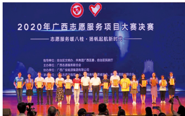
2020年广西志愿服务项目大赛现场。