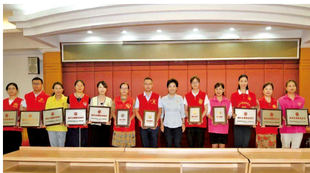
邢善萍为获评2019年度全国学雷锋志愿服务“四个100”先进典型和疫情防控最美志愿者颁奖。

坚持以习近平总书记重要讲话重要指示批示精神统领学雷锋志愿服务工作,把福建新时代学雷锋志愿服务不断引向深入。精心组织新时代宣讲志愿服务,结合学习宣传贯彻《习近平谈治国理政》第三卷和《习近平在福建》等系列采访实录,推动党的创新理论深入人心、落地生根。服务中心大局,围绕统筹推进常态化疫情防控和经济社会发展、决战决胜脱贫攻坚、新时代新福建建设、承办世遗大会等中心任务和重大活动开展志愿服务,主动融入全方位推动高质量发展超越。深化新时代文明实践中心建设,推进文明实践志愿服务精准化、常态化、便利化、品牌化。完善应急志愿服务体系,提高社会治理现代化水平。