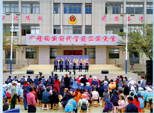
贵州省龙里县湾滩河镇湾寨社区文明实践站举办“唱响新时代主题山歌大赛”。