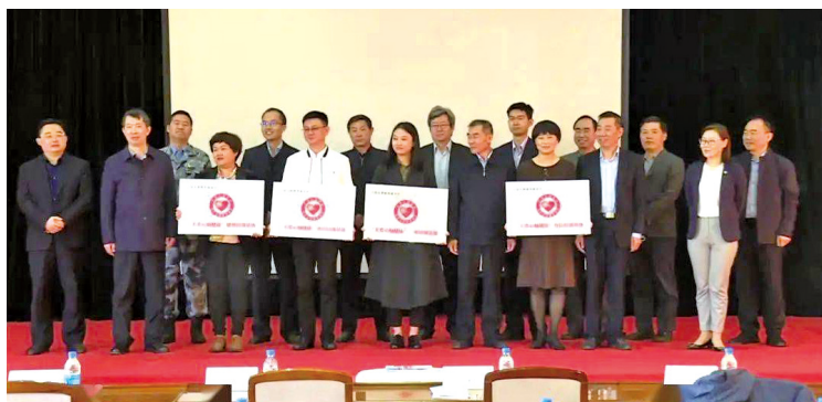
10月18日“关爱心脑健康”志愿扶贫项目在北京启动。

10月18日,由中央文明办、中国志愿服务联合会指导,空军特色医学中心主办、中国平安集团支持的“关爱心脑健康”志愿扶贫项目启动仪式暨心脑血管健康精准诊疗研讨会在京举行。