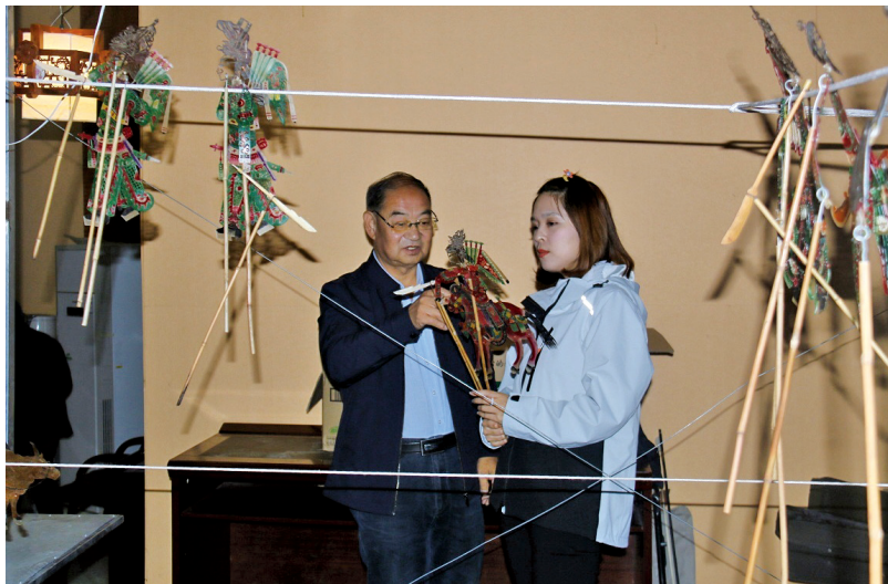
文艺志愿者在甘肃省参加直播推介活动。

8月23日,由中央文明办、文化和旅游部、中央广播电视总台联合主办的“央视频号·文化志愿者专列”正式启动后,一路隆隆前行,鸣响了贫困地区文化旅游资源直播推介活动的汽笛声声。