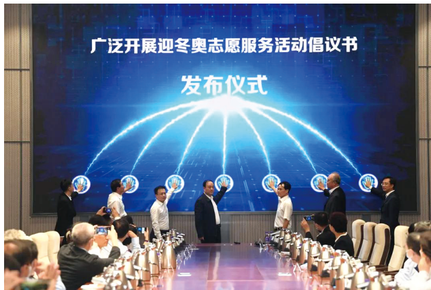
9月21日,《广泛开展迎冬奥志愿服务活动倡议书》在北京发布。