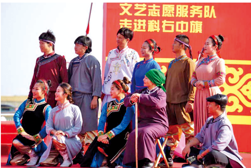
科右中旗乌兰牧骑队员参与“我们的中国梦”——文化进万家演出活动。

党的十八大以来,中宣部作为定点帮扶单位,认真贯彻落实习近平总书记关于脱贫攻坚的重要指示精神,采取切实措施,加大扶贫工作力度。部领导高度重视,多批机关干部前往科右中旗,深入牧场、嘎查、学校、农田开展调查研究,与当地人民群众共同谋划,明确了“吃生态饭、做牛文章、念文旅经”的发展思路。2019年4月,科右中旗摘