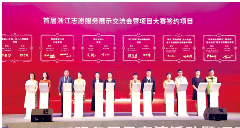
2020年浙江志愿服务项目大赛现场。