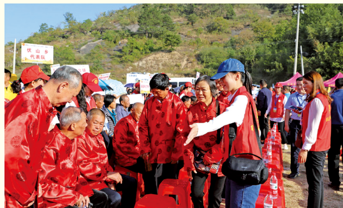
河南商城县志愿者服务“农民丰收节”活动,成为靓丽风景线。