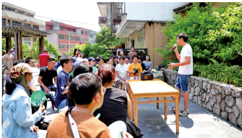
温州青年志愿者宣讲团成员在文成县“乡村美丽庭院”为侨眷作党的创新理论宣讲。

牌引领,弘扬“温州大爱”精神,引导更多市民参与志愿服务。“四十八年如一日,一粥一茶温暖一座城”的红日亭、“20余年践行公益医疗”的温州医科大学眼视光学院相继成为全国学雷锋活动示范点。“雪君工作室”“海霞妈妈”“志愿服务时间银行”“温州志愿热图”“最美志愿者系列评选”等品牌的影响力日益广泛。在红日亭等品牌示范带动下,越来越多的温州市民,包括大中小学生和外国留学生纷纷参与其间,各类“红日亭”更如雨后春笋般涌现。据不完全统计,如今遍布温州城乡的大小伏茶点、爱心服务点已有1000多处。成立于2019年的“瑞城蕙姐”志愿服务队,集平安妈妈团、帮帮团、河嫂清水护卫队、文化宣传等各具特色的巾帼志愿服务队伍为一体,带领妇女积极投身平安创建、乡村振兴、垃圾分类、疫情防控等中心工作等各项社会服务。