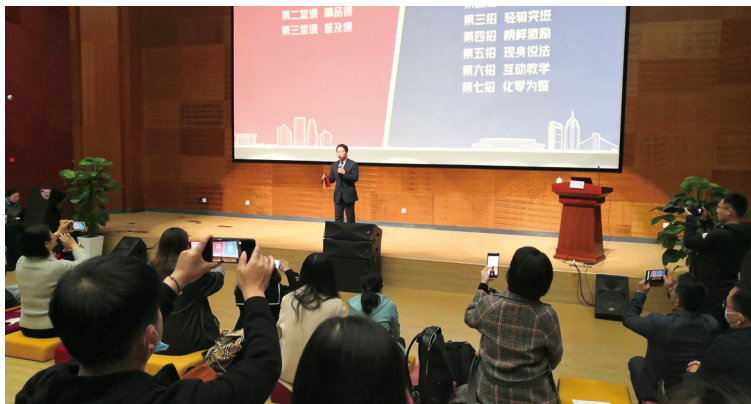
宁波市鄞州区微型党课现场演示授课令人耳目一新。

通俗“区级精品课”讲活理论。 组织中央音乐学院、宁波大学等高校艺术力量，文艺、社科理论工作者开展研讨交流，深入谋划打造精品文艺微党课。将文艺微党课纳入区文艺精品创作项目，通过创作服务、过程监督、资金补助、组织创作营等，提升创作质量。目前，全区选出首批15位文艺微党课高级讲师，创作