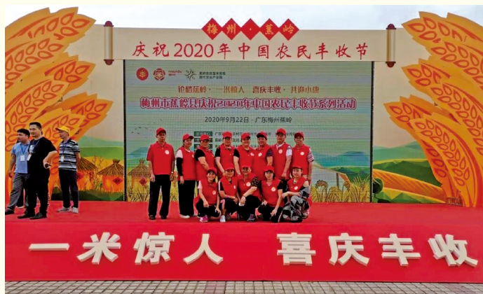
广东蕉岭县志愿者开展“一米惊人、喜庆丰收”宣传活动。