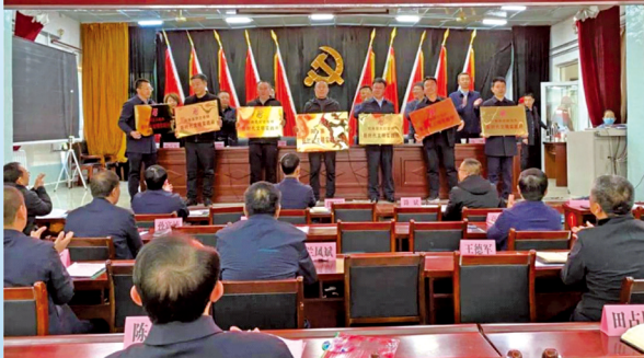
新时代文明实践中心建设重在党委政府重视，山西大同市阳高县召开新时代文明实践中心建设推进会。